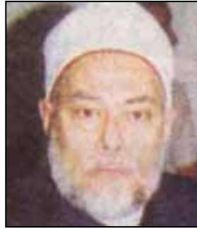
השיח' הדוקטור עלי ג'מעה

[מתור אתר האינטרנט של ארגון "מפהומ", פרויקט "ההחלטה הערבית" 2 . המידע מעודכן ל-29 ספטמבר 2003].